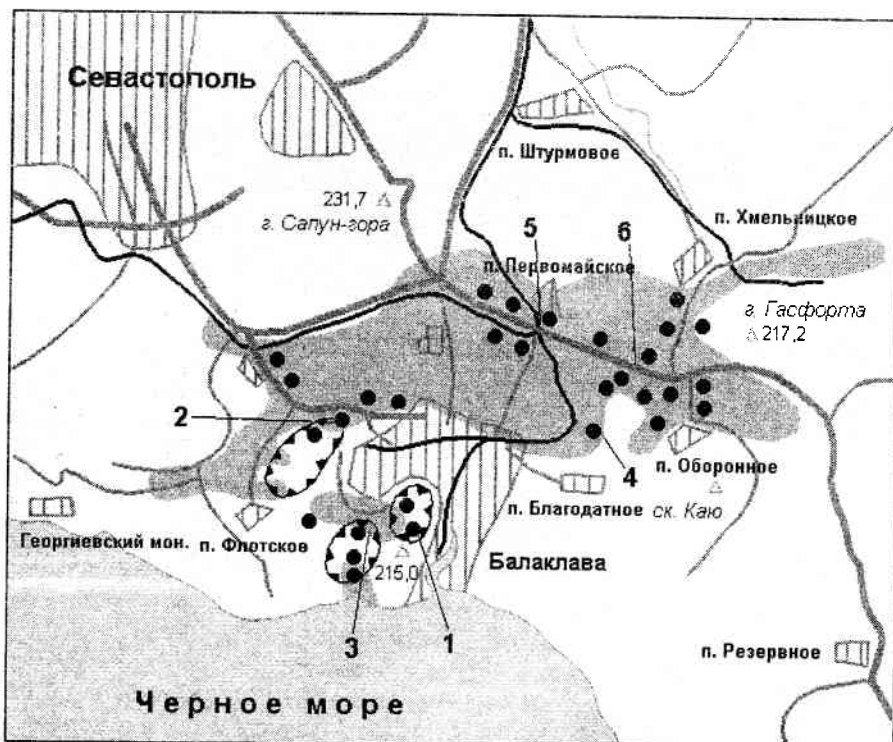
Рис. 1. Схема расположения обнажений валунно-глыбовой олистостромы в альбских осадочно-вулканогенных отложениях Балаклавской котловины

1 – старый Балаклавский карьер на горе Таврос (юго-западная стенка); 2 – Кадыковский карьер (северо-восточная стенка); 3 – Псилерахский карьер (юго-восточная и северо-западная стенки); 4 – старый карьер у железной дороги; 5 – железнодорожная выемка у кафе "Солнышко"; 6 – склоны холма у знака въезда в г. Севастополь на автотрассе Севастополь–Ялта. Серым цветом показано распространение альбских отложений, черными кружками – свалы валунов магматических пород