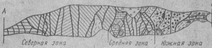
Схема расположения и строения горизонта глибовых известняков Верхний триас: 1 — песчано-глинистый флиш; 2 — флиш в зоне истирания; 3 — вулканогенные породы в зоне истирания; 4 — конгломераты и песчаники с прослоями алевролитов; 5 — лейас; 6 — глыбы юры: валунные конгломераты; 7 — верхняя юра: конгломераты, песчаники; 8 — известняки, песчаники, глины; 9 — глыбы известняков; 10 — современный делювий; 11 — разломы; 12 — глибовый горизонт на плане; 13 — линия поперечного разреза

живущего биогерма. Возраст глибового горизонта трактуется в данном случае как тоарский.