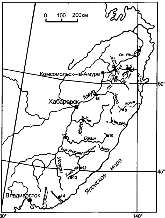
Рис. 1. Схема местонахождений фауны.

Несколько выше предыдущего местонахождения по течению р. Амур, в т. 15 (сборы Б.Я. Черныша, 1962 г., обр. 01303), были найдены Eogaudryceras ( Eotetragonites ) cf. duvalianus d'Orb. (табл. I, фиг. 2) и Inoceramus sp. [4]. Образец, встреченный в бассейне реки Гур, (рис. 1, р. Почепта, т. 16), вместе с Pseudotetragonites cf. kudrjavzevi Druzic [4, 6], скорее всего, является представителем Cleonicerias sp. (табл. II, фиг. 16). Несмотря на плохую сохранность данного экземпляра, можно сказать, что он ближе всего к Cleonicerias ( Grycia ) sablei Imlay [15] из альба Аляски или к Cleonicerias ( Grycia ) dubium (I. Michailova et Terechova), установленному на Северо-Востоке России, в бассейне р. Майн [7]. В работе Е.А. Калинина