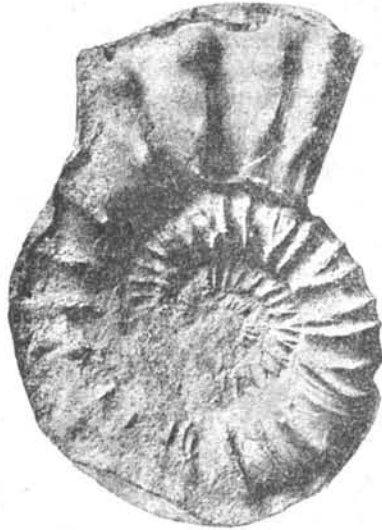
Рис. 4. Peltoceras athletoides Lahusen, — по гипсовому слепку.

От оригиналов Лагузена мой аммонит отличается тем, что у него одиночные ребра отстоят шире друг от друга, и умбо-нальные бугорки выражены сильнее. В этом отношении последний полуоборот моего аммонита походит на соответствующий