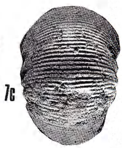
Fig. 6-7. Olcostephanus balkanicus . (Транков) Дневник in Булої, 1930. DSEK, Dijon.