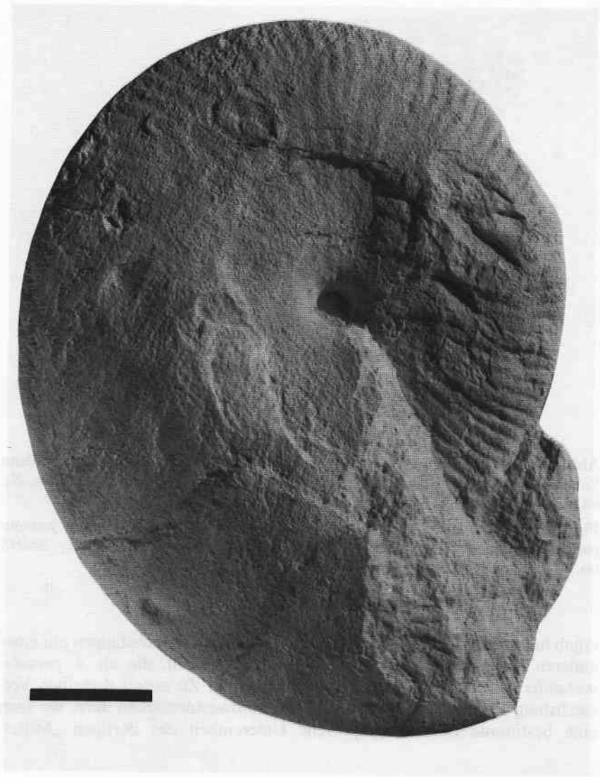
Fig. 3. Aulacostephanus yo (D'ORBIGNY). Obere Felsenkalke Formation. Subemela Subzone (probably upper part), "Michelreibershalde" near Gerhausen. Ulm collection, no. 154/116 (leg. L. SCHÄFLE). – Diameter 31 cm (Scale bar 5 cm).