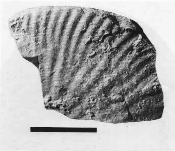
Abb. 2. Aulacostephanus yo (D'ORBIGNY). Obere Felsenkalk-Formation, höhere Subeumela-Subzone. Blaustein-Ehrenstein, Stbr. "Schammmental". SMNS Inv.-Nr. 64102 (leg. J. BAIER). – Maßstab 5 cm.